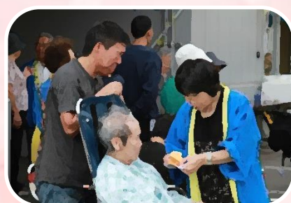
夏祭りでのひとこま