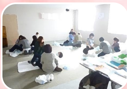
排泄ケア学習のひとこま