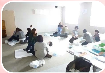
排泄ケア学習のひとこま