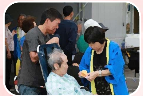
夏祭りでのひとこま