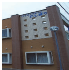
グループホームにしぼり