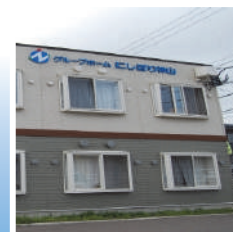
グループホームにしぼり神山