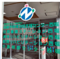
介護相談センター西堀